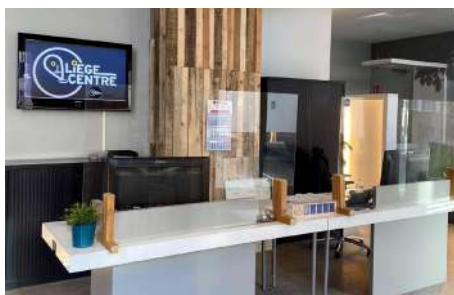
Accueil des nouveaux bureaux de l'asbl

Ce déménagement a permis à l'asbl liégeoise d'améliorer son cadre de vie par un apport de lumière naturelle, mais aussi d'accueillir le public dans un espace de vie plus spacieux et convivial. L'équipe a le plaisir de vous accueillir du lundi au vendredi de 9h à 17h dans ses nouveaux bureaux.