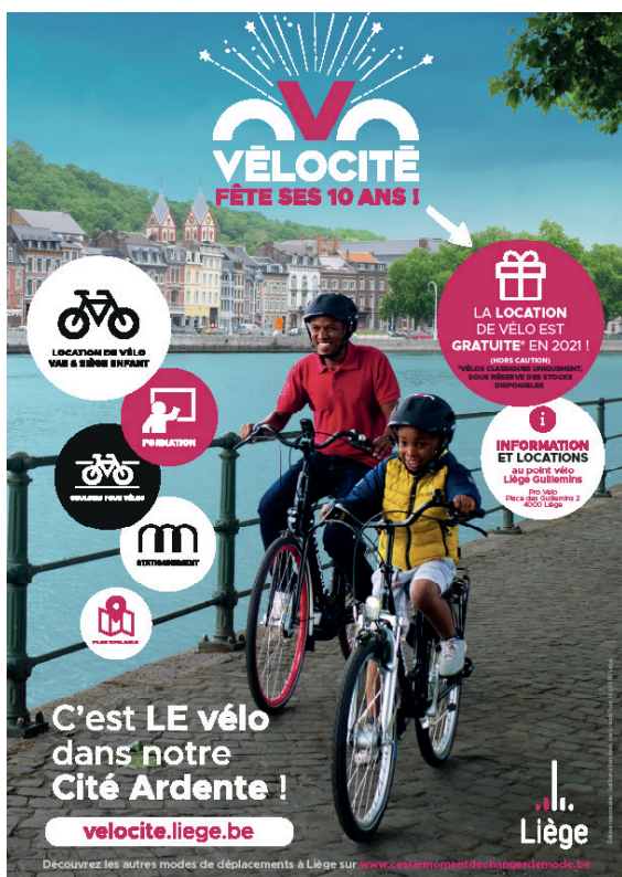
Campagne d'affichage «Vélocité fête ses 10 ans»

Locations de vélos gratuites toute l'année 2021 (lancement le 1 er mars)